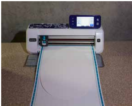
Support standard pour ScanNCut 12 po x 24 po