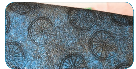
N'ayez pas peur de la paillette!

Youppi, des paillettes! Ajoutez un peu de paillettes en aérosol et un peu de paillettes libres sur le rabat de votre sac à main. Utilisez un tampon encreur pour tissu noir et un tampon décoratif pour accentuer le rabat couvert de paillettes.