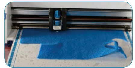
Découpez 3 fleurs funky, 4 feuilles vertes et 3 cercles jaunes

Lorsque vous aurez trouvé les bons réglages, découpez 3 fleurs funky, d'une grandeur d'environ 2,5 po, dans des feutres de 3 couleurs différentes. Découpez 4 feuilles vertes et 3 cercles jaunes (0,7 po).