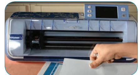
Préparez votre support

Faites quelques tests de découpe, en ajustant selon l'épaisseur de votre feutre. (Pour le feutre artisanal typique, nous utilisons la lame de découpe standard réglée à une profondeur de lame de 8, à une pression de découpe de 5 et à une vitesse de découpe de 1.)